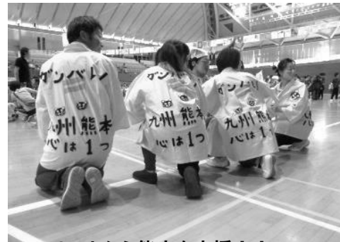
アリーナから熊本を応援！！