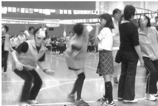
お好みのパンをゲット！！