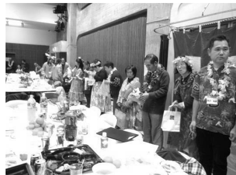
何が当たったかな？