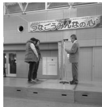
実行委員長より表彰される 「エンジェル」の代表者

わらの四季」をパッチワークで表現したタペストリーが、約40点の作品の中から投票の結果、見事金賞に選ばれました。