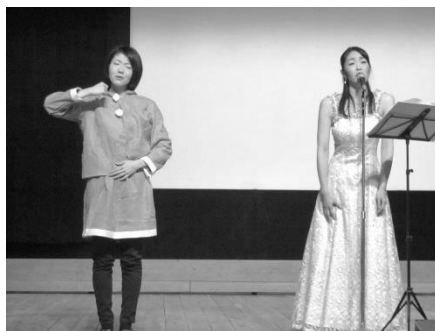
きれいな歌声を披露して下さった フェリスタスのお二人