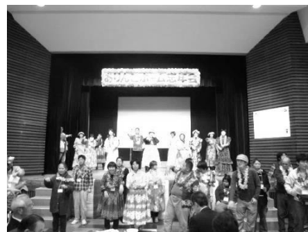
利用者全員で創作ダンスを披露