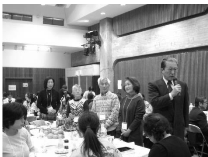
参加者全員を紹介